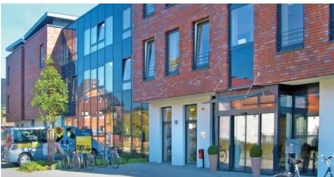
Das benachbarte DSG-Pflegewohnstift

Die Service-Wohnanlage befindet sich in unmittelbarer Nähe unseres DSG-Pflegewohnstiftes.