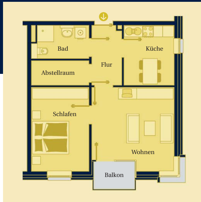
Wohnbeispiel 2-Zimmer Apartment mit 59 m 2